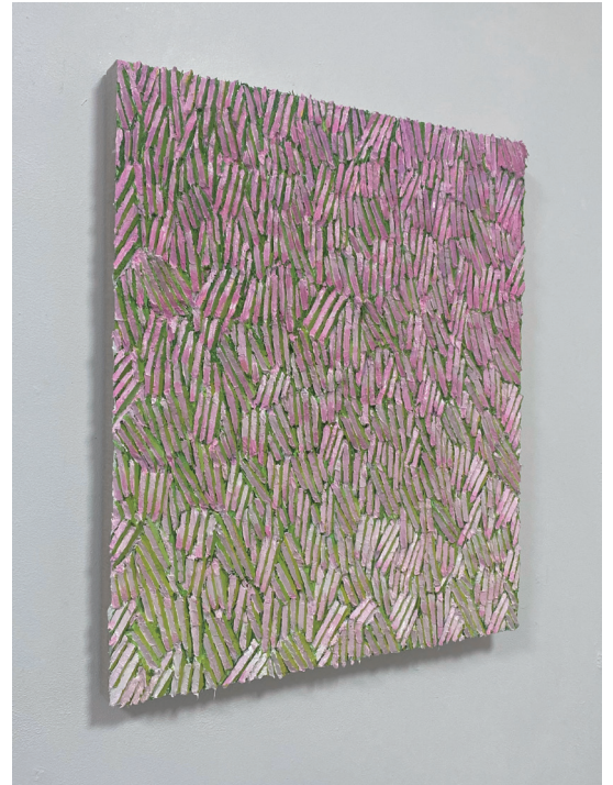
中津川博之 《Transition Blossom #3》 2025, oil, linen, panel, 530×455×30mm