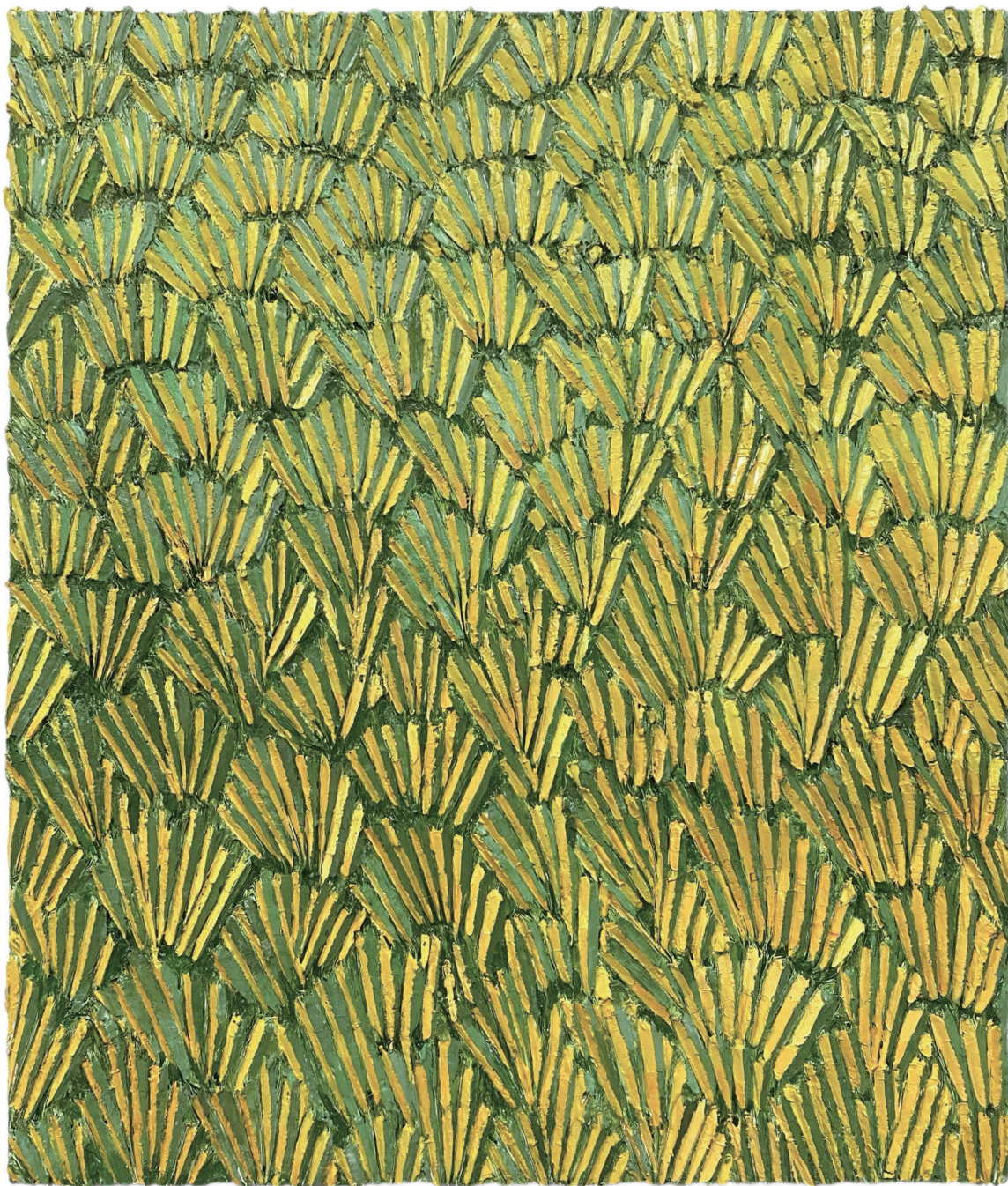
中津川博之《Transition Blossom#1》 2025, oil, linen, panel, 530 × 455 × 30mm