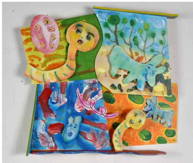
永畑智大「コマわり大陸」2021年 木、ベニヤ板、水性塗料 42×47cm