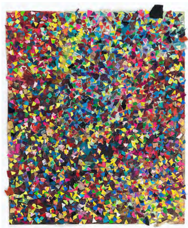
Hans Andersson, 《untitled》, 2020, Mixed media on found paper, 49.5 × 42 cm