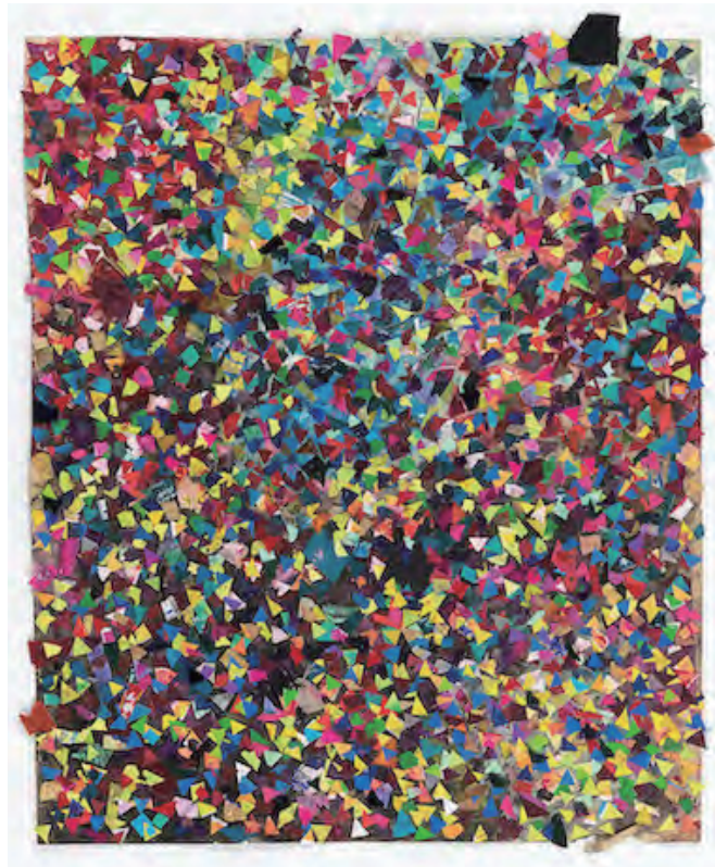
Hans Andersson, 《untitled》, 2020, Mixed media on found paper, 49.5 × 42 cm